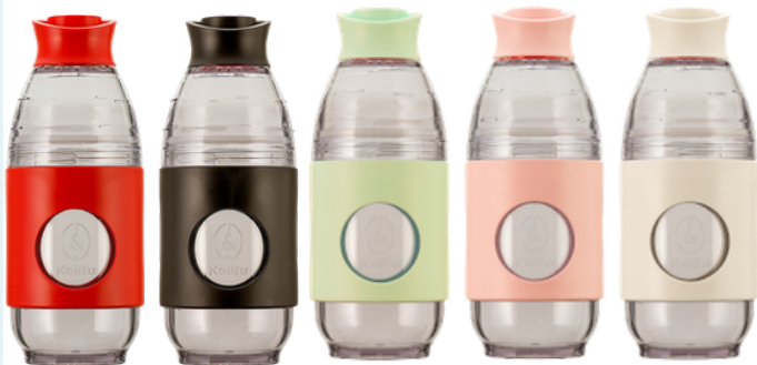
Red Black Mint BabyPink Ivory

レッド、ブラック、ミント、ベビーピンク、 アイボリーのポップカラー。 気分やスタイルに合わせて選べる5カラー展開。